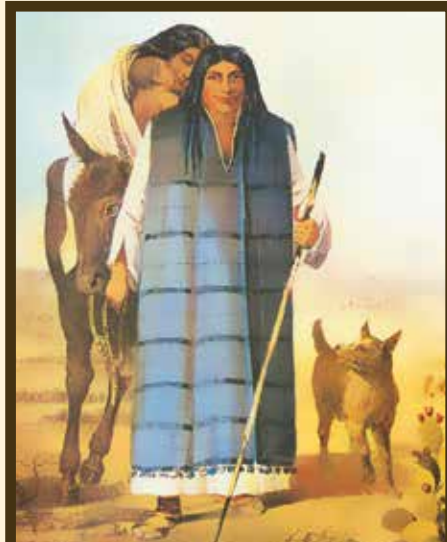
Indígenas Kumeyaay dibujados por un artista de la expedición de la Comisión de Fronteras de los Estados Unidos (U.S. Boundary Commission) del año 1849

Los Kumeyaay vivieron en el Río de San Diego en la aldea que llamaban Kosa'aay. Por miles de años, las personas migraban entre el océano y las montañas; recolectaban alimentos de origen marino, bellotas y lo que necesitaban para vivir. Actualmente un paisaje de plantas autóctonas marca parte del territorio de esos primeros asentamientos antes de la llegada de los españoles. Al comienzo, los colonos españoles fueron bienvenidos por los Kumeyaay, pero las dificultades que enfrentaron sus tradiciones afectaron cada vez más sus vidas. La cultura Komeyaay demostró ser resiliente, y actualmente muchos Kumeyaay continúan con orgullo sus tradiciones con adaptaciones modernas.