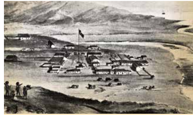
Old Town San Diego, 1846

A pesar de las órdenes españolas que restringían severamente el comercio con otros países, los padres españoles intercambiaron pieles de nutria, cueros de vaca y sebo por bienes manufacturados y artículos de lujo de los Estados Unidos, Europa y China.