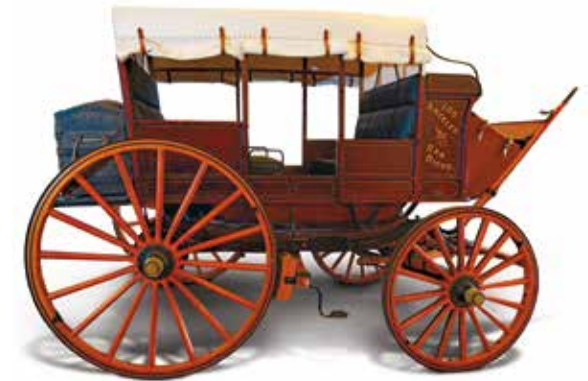
Reproducción de diligencia de la línea Seeley en el Museo de Establos Seeley

La disminución de la presencia militar y la pérdida del negocio relacionado con la minería de oro pronto convirtieron a San Diego en una pequeña comunidad insular. En el censo de los