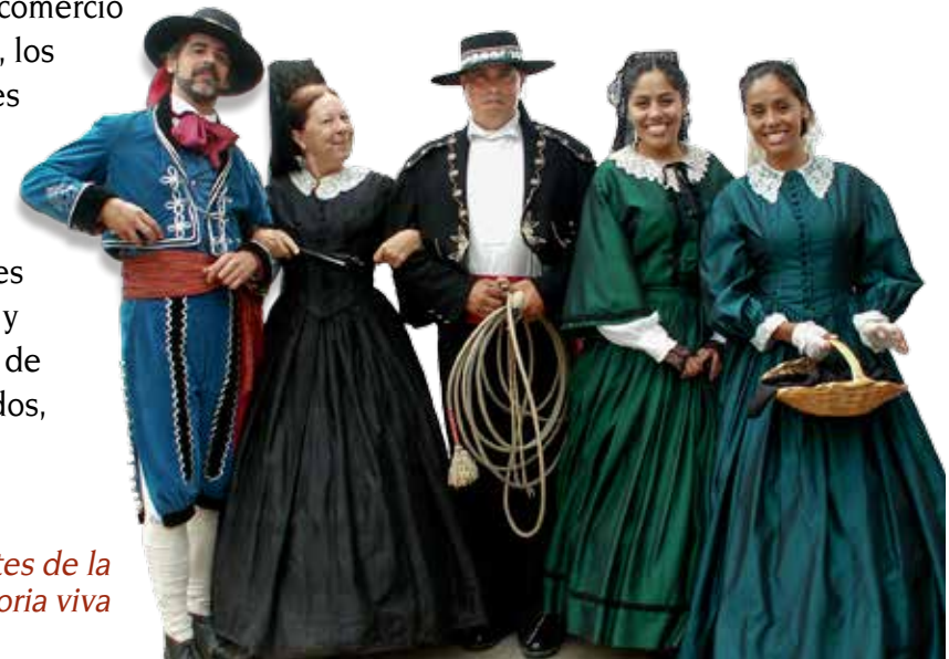
Participantes de la historia viva

Los soldados españoles comenzaron a construir residencias debajo de Presidio Hill a comienzo de la década de los veinte del siglo XIX. Los ladrillos de adobe secados al sol eran su material de construcción tradicional, dado que la