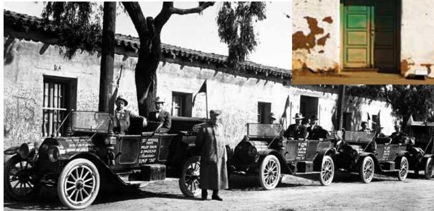
Parte superior: Casa de Estudillo; Parte inferior: paseo en automóvil alrededor de 1920

Las temperaturas moderadas de San Diego ofrecen condiciones ideales para visitas durante todo el año. Con un promedio de solo diez días de lluvias anuales, las