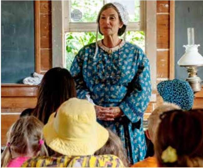
Historia viva: un paseo educativo escucha a una maestra de escuela de 1865

temperaturas varían desde los 60 a los 80 grados a lo largo del año. La neblina costera usualmente cae en las tardes.