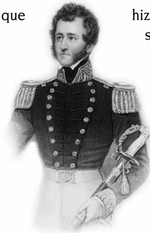
Comodoro Robert F. Stockton

El período mexicano de San Diego terminó de manera abrupta en 1846, cuando los Estados Unidos declararon la guerra a México. Al inicio, los residentes ofrecieron poca resistencia a la ocupación estadounidense, pero a la larga la situación