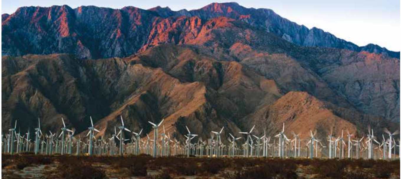
Vista de la Cordillera de San Jacinto desde el Paso San Gorgonio

Los Cahuilla, californianos nativos, usaban el área para la cacería por temporada. Atravesaban los cañones boscosos y los valles protegidos recolectando alimentos y otros