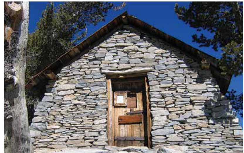
Refugio de emergencia construido por el Cuerpo Civil de Conservación ubicado debajo del Pico San Jacinto.

Para acampar los fines de semana en uno de los cuatro campamentos estatales del área silvestre se debe obtener un permiso con antelación. Las solicitudes de permiso para el Parque Estatal de Vida Silvestre Monte San Jacinto están disponibles en www.parks.ca.gov/msjsp . Realice los trámites con al menos dos semanas antes de su visita para que se emitan y se le entreguen los permisos. Para obtener información sobre el campamento del USFS y los permisos, visite www.fs.usda.gov/sbnf .