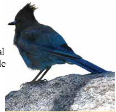
Arrendajo de Steller

Una caminata corta desde la estación de tranvía lo lleva a Long Valle, donde se encuentra una estación de guardabosques, una zona para picnics, baños, un centro de