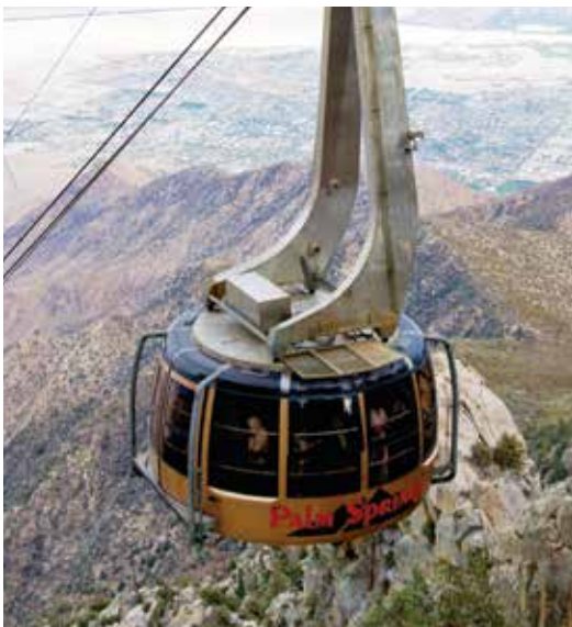
Tranvía aéreo de Palm Springs

recursos. Sus senderos todavía atraviesan la montaña, y muchos morteros de lecho de roca se pueden ver en el parque o cerca de este. Los morteros se remontan a cientos o tal vez miles de años, lo cual evidencia la presencia humana a largo plazo.