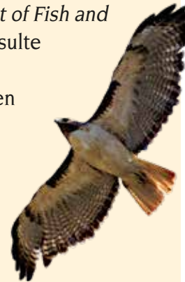
Ratonero de cola roja