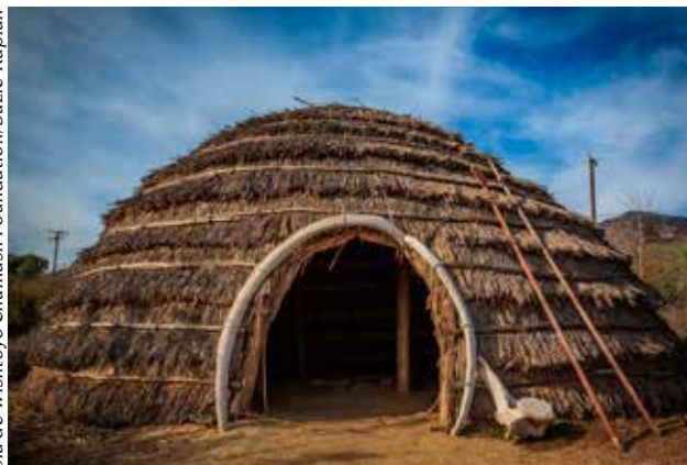
Vivienda Chumash 'ap hecha de tule y sauce