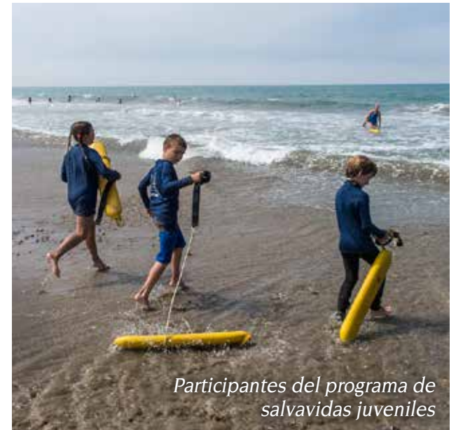
Participantes del programa de salvavidas juveniles