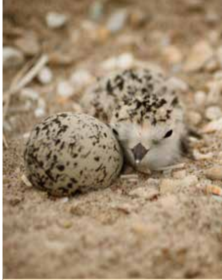
Pichón de chorlo nevado occidental

La anidación del chorlo nevado occidental, un ave playera en peligro de extinción, con buen camuflaje y del tamaño de un gorrión, se puede observar en la playa. Hay señalizaciones de