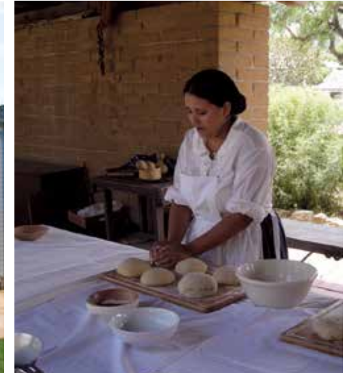
Preparación del pan para el horno

1834 se designó al General Castro como comandante del distrito de Monterey de Alta California quien se desempeñó como gobernador hasta 1836. En 1846, el explorador John C. Frémont y el legendario Kit Carson plantaron la primera bandera de los Estados Unidos en California sobre la Cumbre Gavilán (actualmente conocida como Fremont Peak) sobre el Valle de San Juan. El General Castro demandó que el grupo Frémont abandonase el territorio mexicano quienes lo hicieron luego de tres jornadas muy tensas.