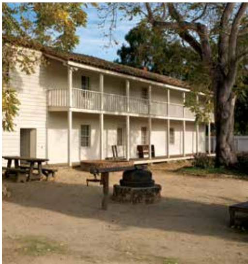
Patio de la casa Castro/Breen