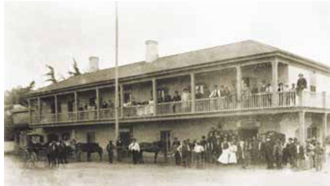
Viajeros del Plaza Hotel, ca. 1875

I magine un lugar donde pueda volver en la historia ay recorrer los caminos de los nativos californianos, los sacerdotes españoles, los funcionarios mexicanos, los inmigrantes Europeos, los mineros y las damas victorianas, todo en un solo lugar.