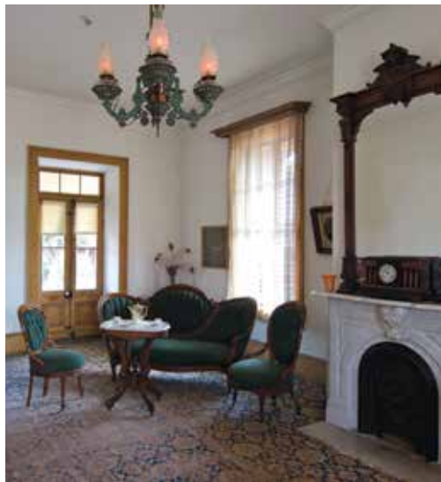
Salón de la casa Zanetta