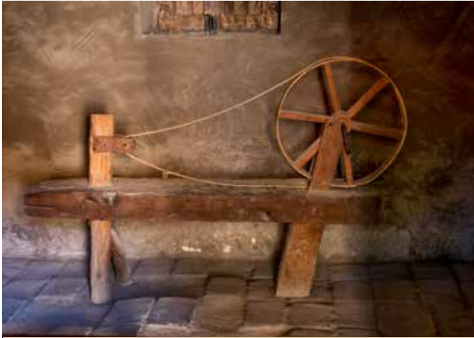
Rueca primitiva en exposición

La segunda misión de Santa Cruz experimentó diversos desafíos, lo cual le otorgó el apodo de “La Misión de la Mala Suerte”. Las enfermedades arrasaron con el pueblo neófito de la misión y muchos