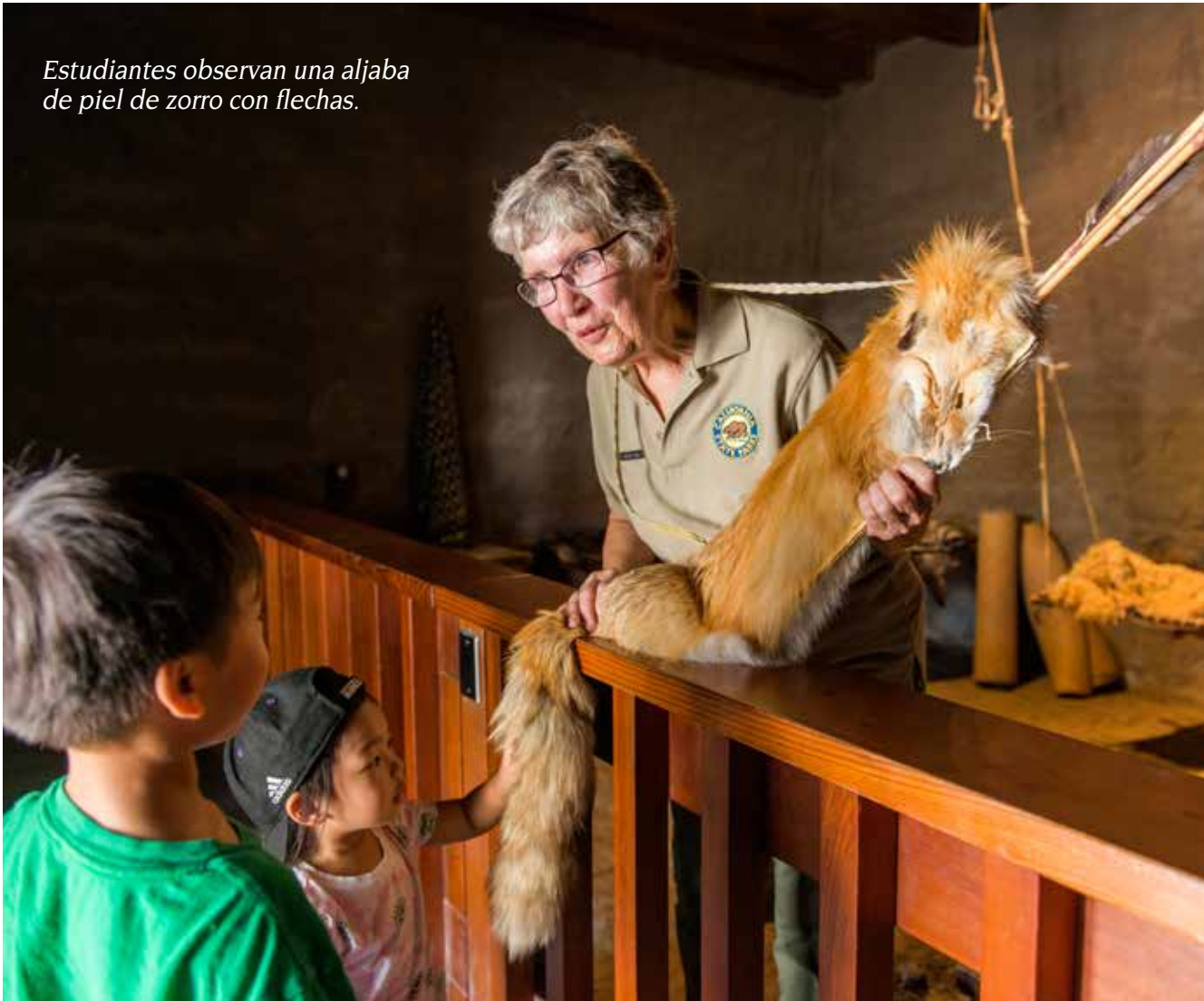
Estudiantes observan una aljaba de piel de zorro con flechas.