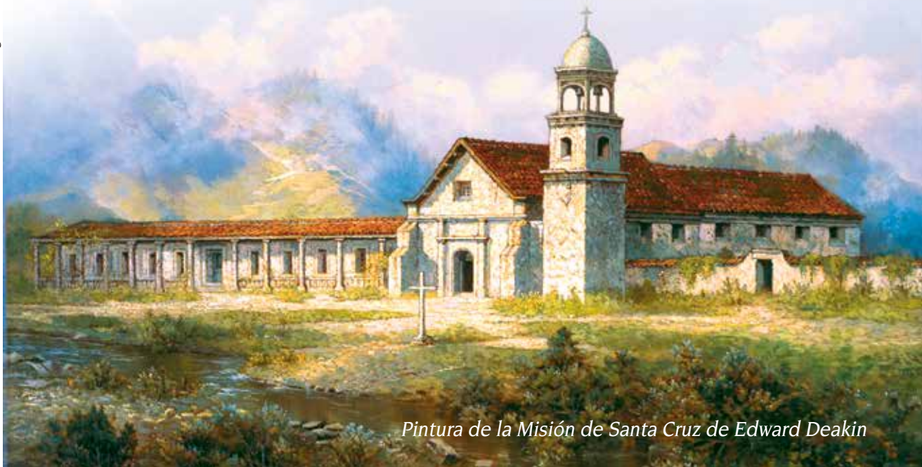
Pintura de la Misión de Santa Cruz de Edward Deakin