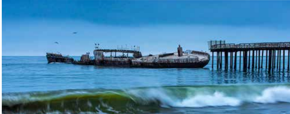
SS Palo Alto

Conocida hacia 1833 como Rancho Aptos, Seacliff se desarrolló como un puerto bullicioso de envíos con un edificio del embarcadero Castro-Spreckels. A mediados de la década de los veinte del siglo pasado,