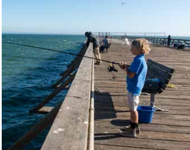
Pesca desde el muelle

pescadores del muelle atrapan lenguado, platija, caballa, fletán, bacalao largo, cabezón bocaccio, pejerrey y en ocasiones salmón y trucha arcoíris. Durante el verano y el otoño, decenas de miles de pardelas oscuras (aves marinas pequeñas de color oscuro) llegan desde lugares tan al sur como Nueva Zelanda, volando en masas sobre el océano en busca de anchoas. A menudo se pueden detectar leones marinos, delfines, nutrias de mar y ballenas migratorias en el agua.