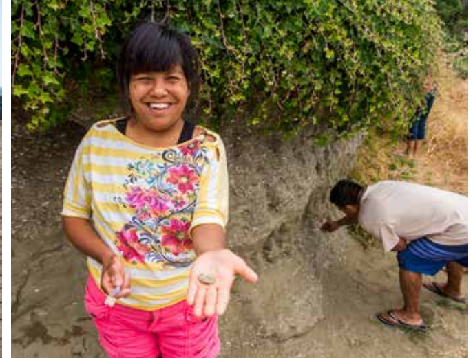
Niños aprenden sobre los fósiles.

El centro de visitantes de Sealiff presenta exposiciones interpretativas de historia natural y cultural, un tanque de poza intermareal y un acuario. Acampar frente al mar en Sealiff es solo para vehículos recreativos. Entre las actividades más populares se encuentran hacer picnics, pescar y paseos guiados sobre fósiles e historia o paseos a lo largo de la playa. Los programas de arte y artesanía para niños ponen de manifiesto la historia de Sealiff.