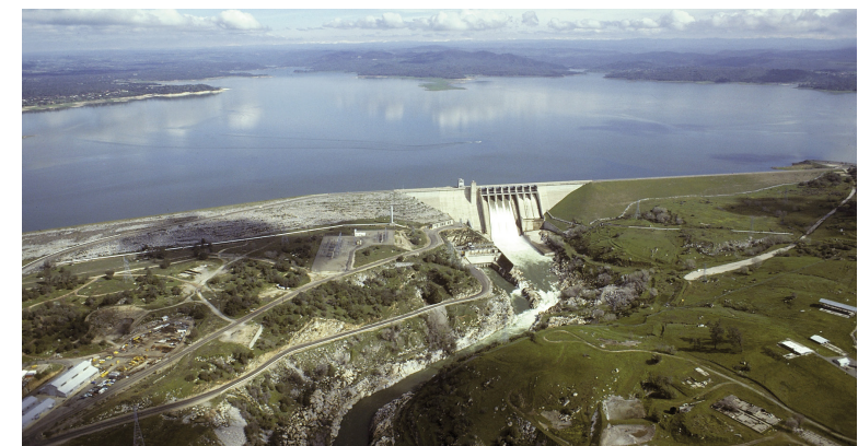
Folsom Lake y represa