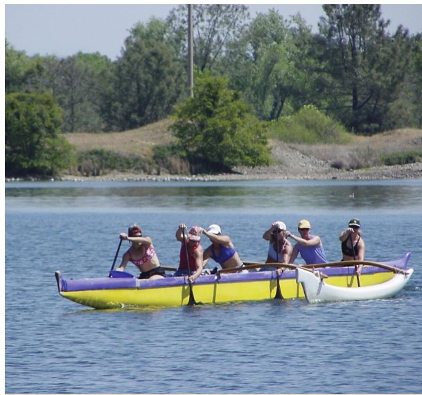
Actividades con canoas en el lago Natoma

estacionamiento accesibles. Todos los lugares cuentan con parrilla. Traiga carbón. El área de pícnics grupales en Granite Bay tiene capacidad para 200 personas. Para realizar una reserva, comuníquese al (916) 988-0205.