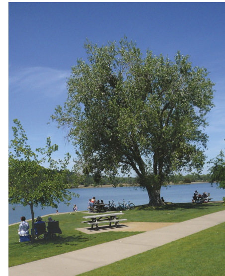
Área accesible para pícnic en el lago Natoma

Ubicada justo al norte de la represa Folsom, Beals Point cuenta con 49 lugares familiares de campamento y con 20 lugares con tomacorrientes para vehículos de recreación, tráileres y casas rodantes de hasta 31 pies. Se encuentran disponibles, y cerca, una estación sanitaria, agua potable y baños