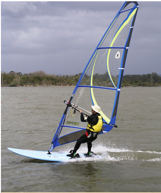
Windsurf en Folsom Lake