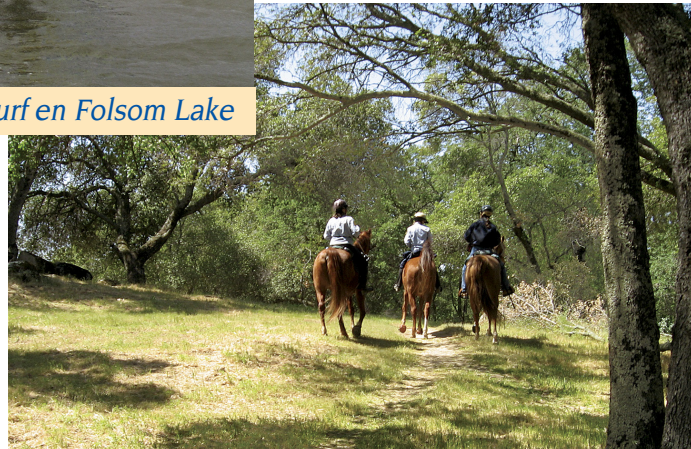
Senderos para cabalgatas en Folsom Lake

de boca grande y de boca pequeña, percas y salmones rojos. Es necesario contar con una licencia de pesca válida para California. El embarcadero y la plataforma de pesca accesibles del lago Natoma se encuentra en Nimbus Flat.