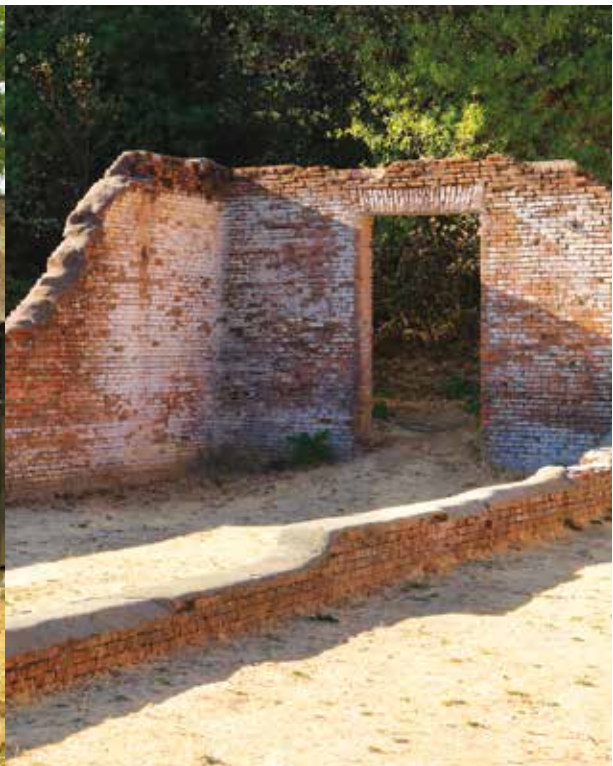
Ruinas de ladrillo históricas

El Palacio de Justicia y la cárcel tienen entradas con rampas. Las pasarelas históricas, entradas angostas y umbrales altos en los edificios históricos pueden impedir el paso. Para actualizaciones de accesibilidad, visite http://access.parks.ca.gov .