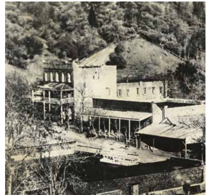
Pueblo de Shasta, ca. 1880

Muchos grupos e individuos reconocieron el valor histórico significativo de la historia de “auge y caída” del pueblo y decidieron