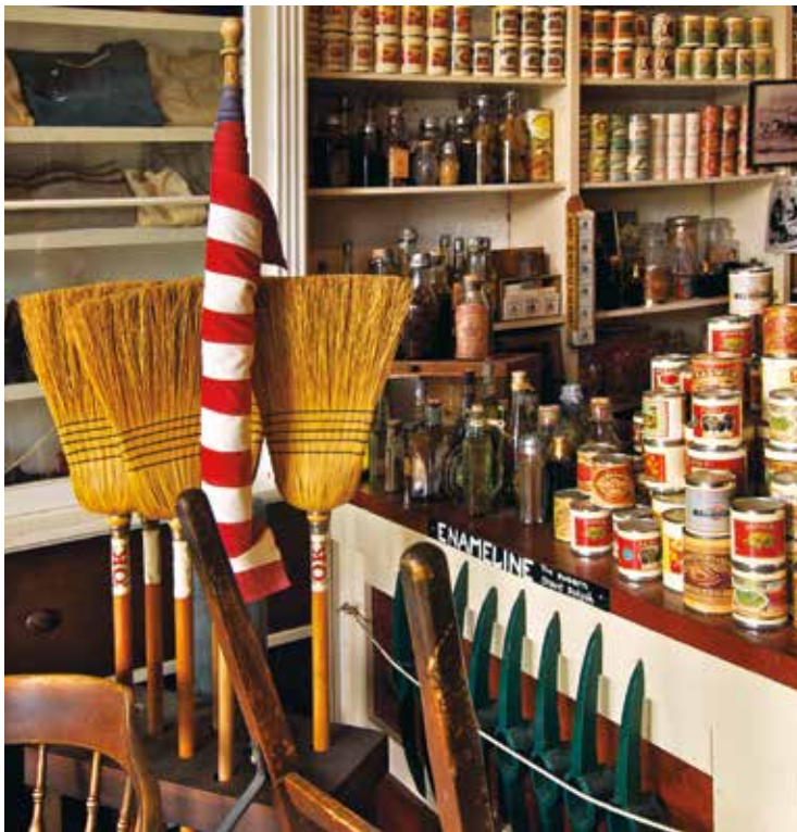
Interior de la tienda Litsch