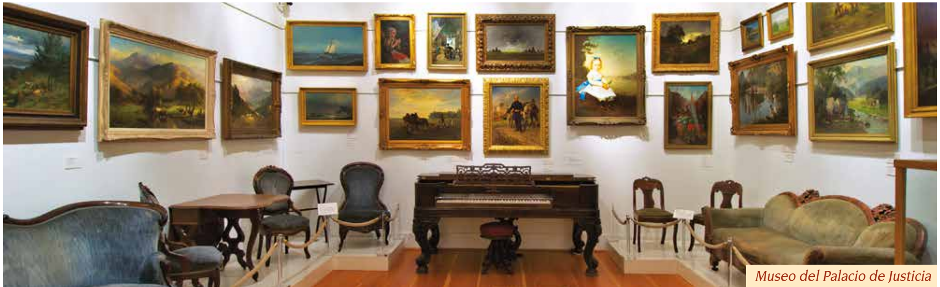
Museo del Palacio de Justicia