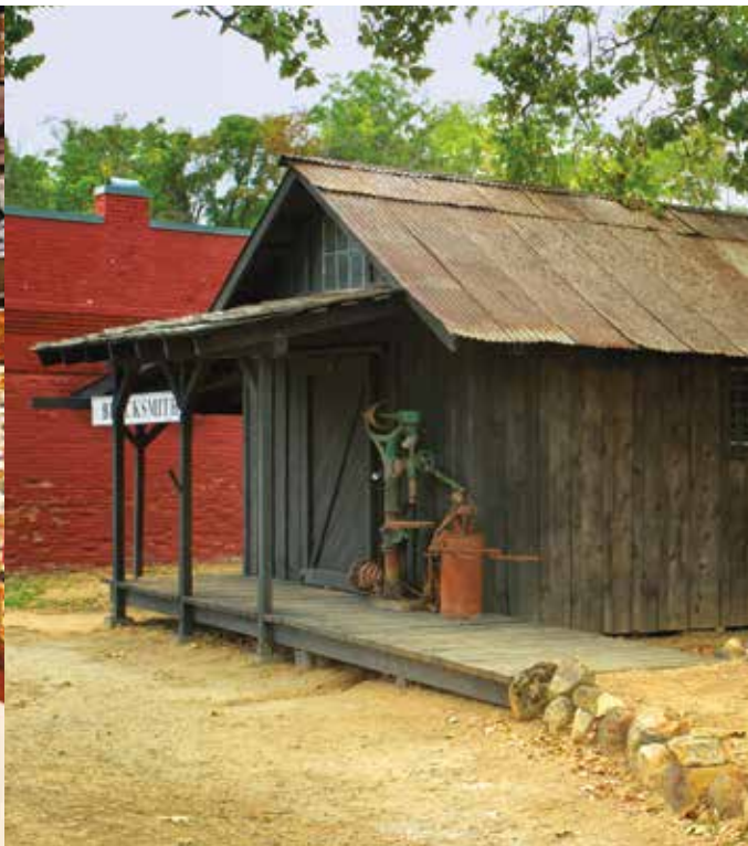
Tienda del herrero

Entre los recorridos guiados se encuentran el museo del Palacio de Justicia, la tienda de mercancía general Litsch y los cementerios. Entre los eventos especiales de verano destacan el dibujo anual " Dinner in the Jail For You and Your 13 Lucky Friends " (Cena en la cárcel para usted y sus 13 amigos con suerte) y representaciones en el teatro Starlight de Shasta. Los recorridos de luna llena en el cementerio se realizan en octubre y la inauguración de las fiestas se realiza el primer sábado de diciembre. Los programas infantiles incluyen arte, historia y naturaleza. Para un cronograma completo del parque, visite www.parks.ca.gov/shastashp .